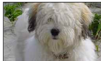
Coton de Tulear

❗ El nombre deriva de la palabra francesa "coton" que significa algodón.